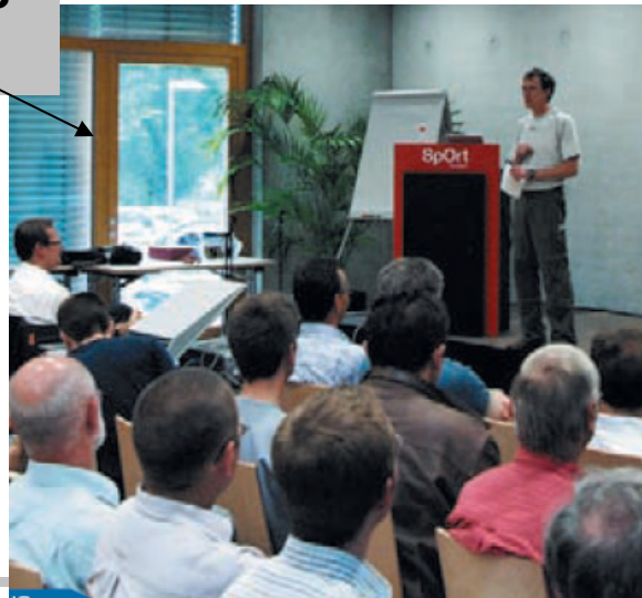
Ansicht Plenum/Tagungs- raum